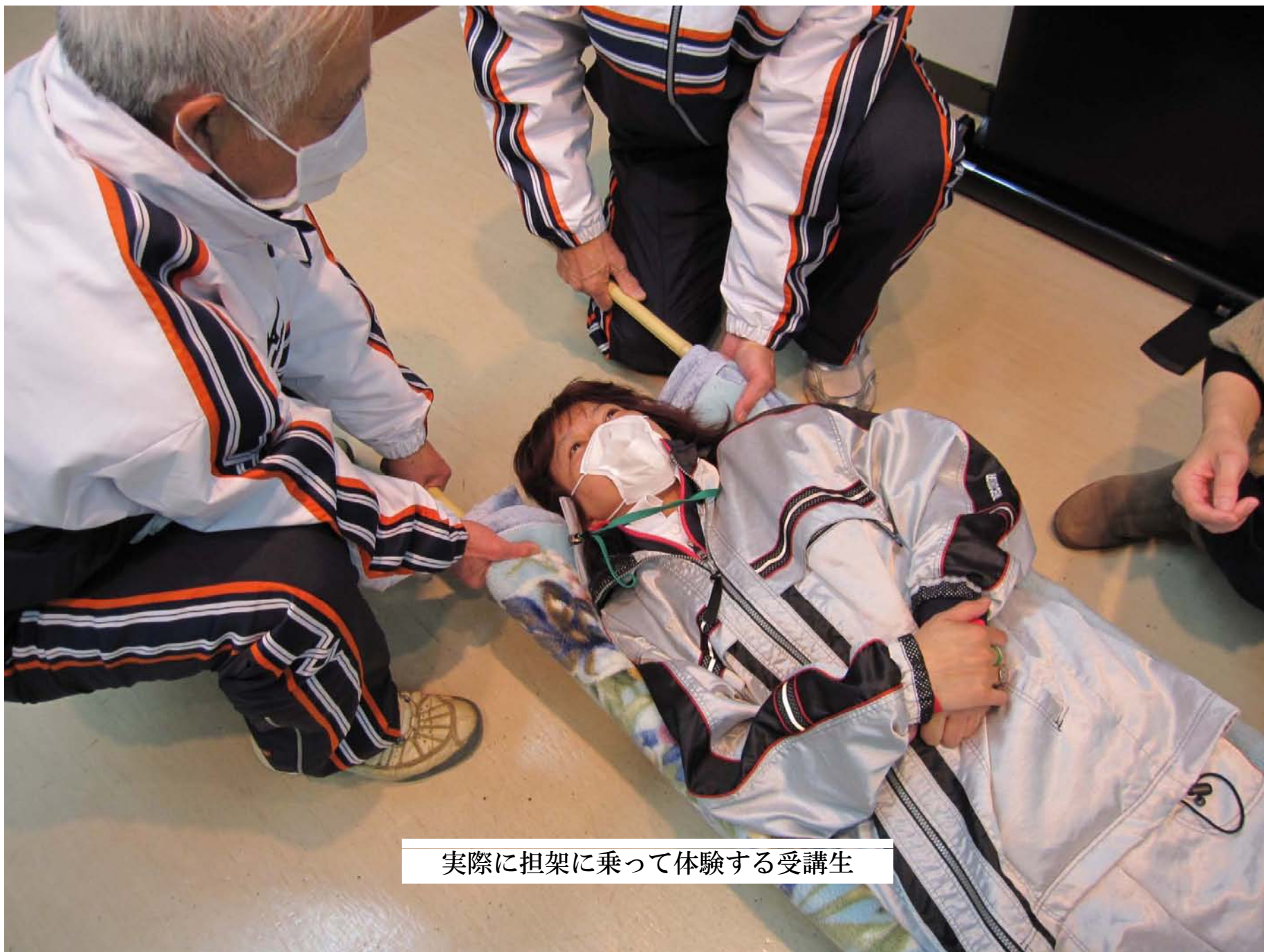
実際に担架に乗って体験する受講生