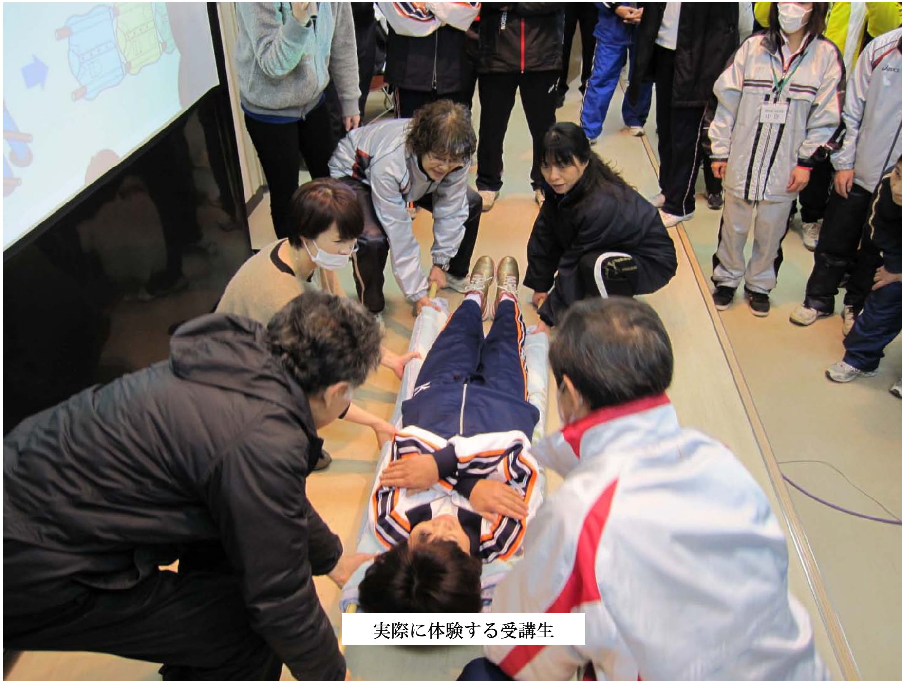
実際に体験する受講生