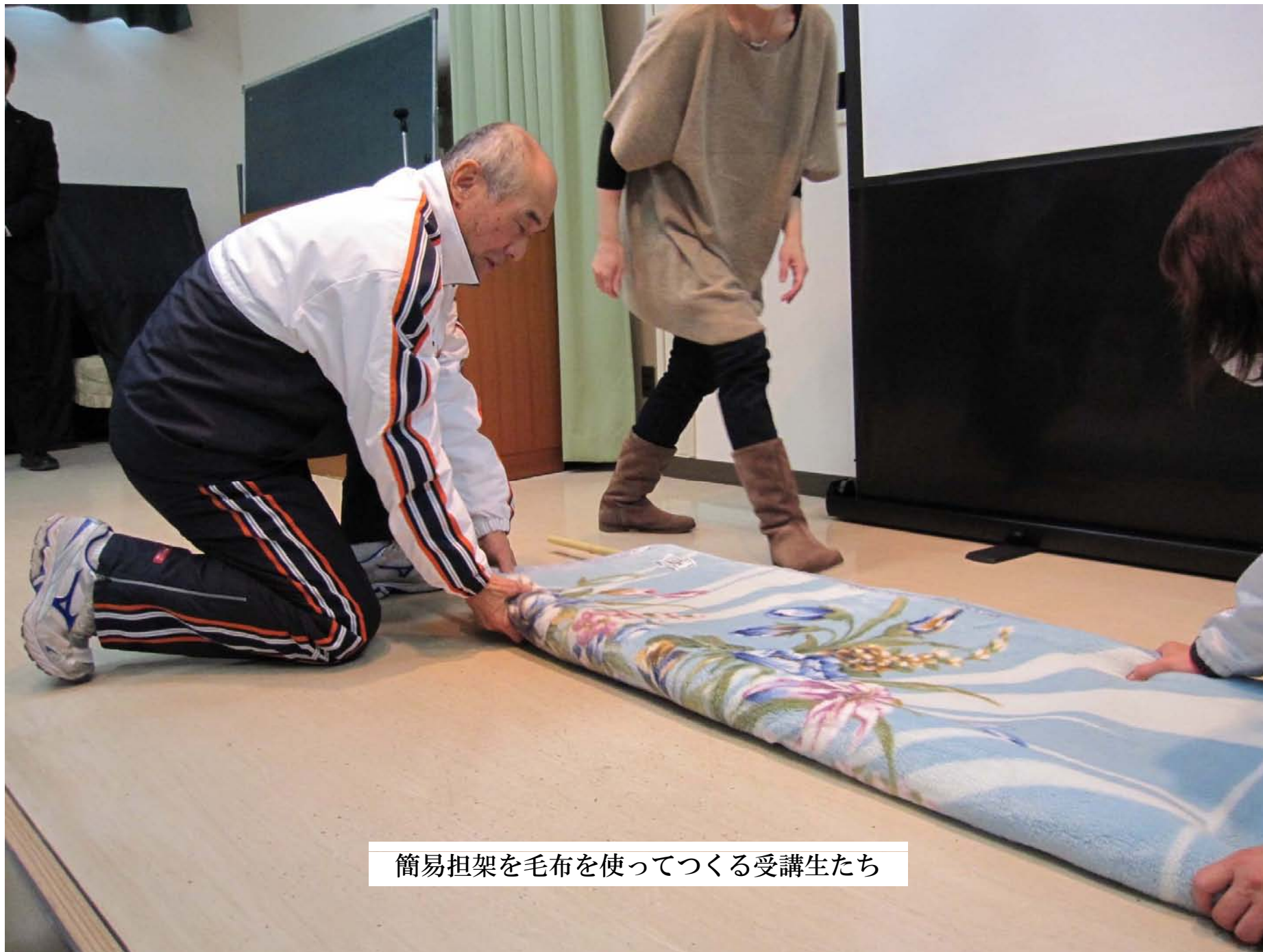
簡易担架を毛布を使ってつくる受講生たち