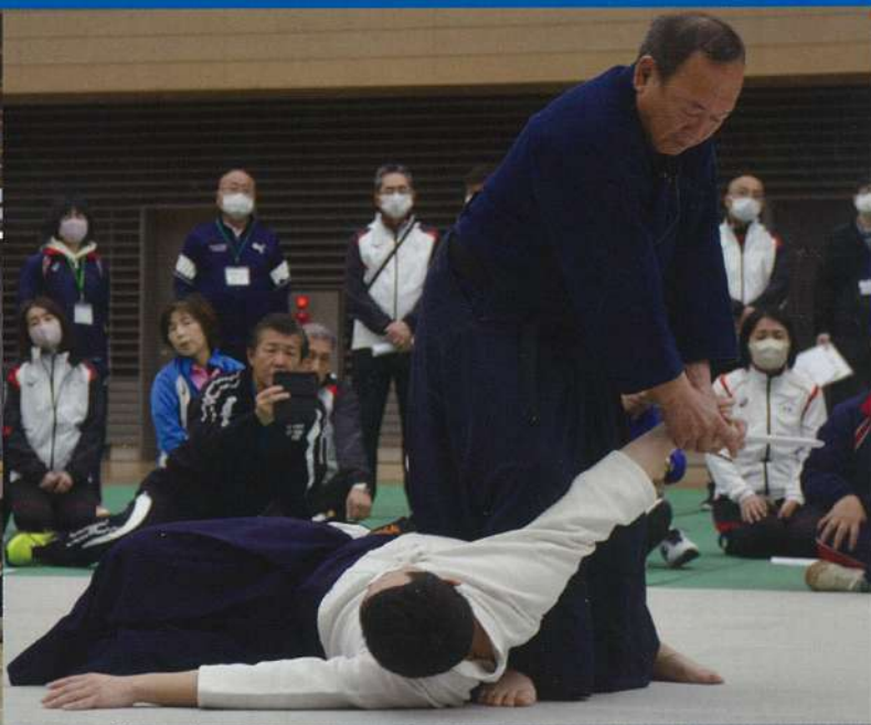
埼玉県スポーツ推進委員協議会 研 修 会